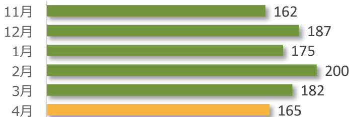
相談件数の推移 (直近6か月)