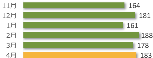
相談件数の推移 (直近6か月)

4月の相談件数は183件で、相談者の内訳は医療機関が76件、遺族等が97件、その他・不明が10件でした。遺族等の求めに応じて相談内容をセンターが医療機関へ伝達したものは6件(累計191件)でした。医療機関から医療事故の判断について相談を受け、センター合議を開催し、医療機関へ助言したものは6件(累計531件)でした。